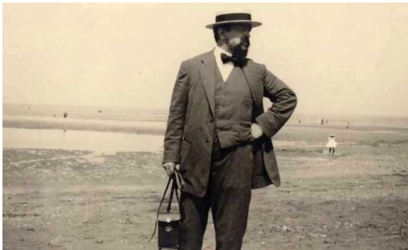
Claude Debussy sulla spiaggia di Houlgate

Elogio della modernità tra astrazione e immaginazione sonora