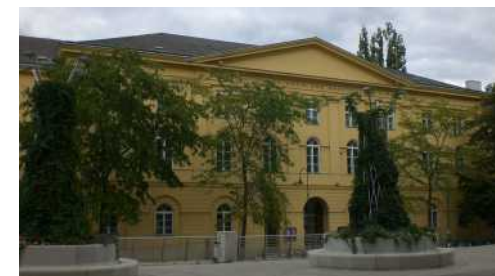
Vienna, Universität für Musik und darstellende Kunst