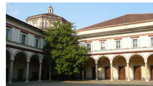
Milano, Conservatorio di musica "G. Verdi"