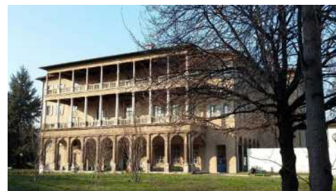
Milano, Civica scuola di musica "Claudio Abbado"