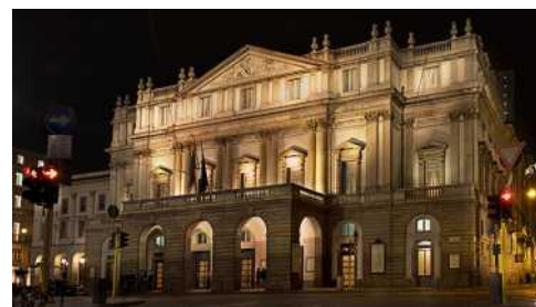
Milano, Teatro alla Scala

L'appuntamento di oggi rappresenta il primo di sei diversi percorsi di ricerca che il progetto Verdi Suite, giunto al suo settimo anno di attività, intende affrontare nella nuova stagione. Interamente dedicato al violino, questo concerto inaugurale affianca esperti professionisti ad alcuni tra i migliori talenti emergenti. Perché tra le molte finalità dell'iniziativa vive più che mai quella di riaffermare il valore fondamentale e imprescindibile del binomio "maestro-allievo", restituendo al primo il ruolo di punto di riferimento che gli compete e fornendo al secondo una importante occasione di confronto e di crescita. Il programma è costruito intorno all'incontro di quattro diverse esperienze didattiche, tutte importanti e ricche di storia: ai violinisti appartenenti alle tre principali istituzioni musicali milanesi ( Scala, Conservatorio e Civica ) si uniscono quelli provenienti dallo Josef Hellmesberger Institut Wien , centro di studi pedagogici per strumenti a corda (archi, chitarra, arpa) della prestigiosa Universität für Musik und darstellende Kunst di Vienna.